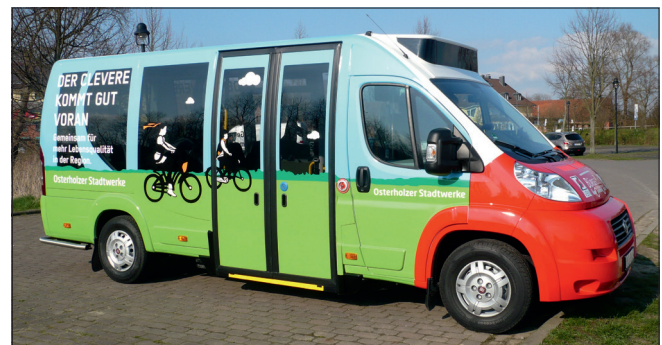
Fahrzeug von der LNVG gefördert

Um es Ihnen als Fahrgast beim Einstieg leicht zu machen, setzen wir auf unserer Fahrt einen komfortablen Niederflerbus ein. Dieser 8-sitzige Bus garantiert Ihnen einen barrierefreien Ein- und Ausstieg. Außerdem können Kinderwagen, Rollstühle und Rollatoren problemlos im Bus verstaut werden.